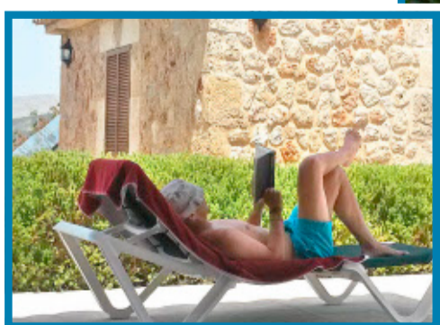
Viel mehr ist nicht: Lesen als tägliches Ritual ...

Ein tägliches Highlight inmitten der gepflegten Unaufregtheit: die blaue Stunde am Pool. Der Wind hat nachgelassen, die Sonne macht langsam Feierabend, verändert Licht und Stimmung. Nach Stunden der Abgeschiedenheit im schützenden Schatten saugen wir die letzten Sonnenstrahlen auf. Ein Gespräch kommt in Gang, wir lachen, wir scherzen, wir trinken. Ein bisschen, schließlich ist der Abend noch lang. Die Kinder sind verschwunden, still und leise nach Stunden im gechlortem Poolwasser, an der Tischtennisplatte, auf der Wiese mit dem Fußball. Wahrscheinlich denken sie, die Alten am Pool hätten nicht gemerkt, dass sie