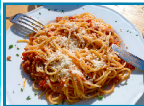
Wichtig: eine Zwischenmahlzeit

abends, ganz so, wie es unsere spanischen Gastgeber vorleben. Längst ist es dunkel geworden. Kerzen zaubern ein schönes Licht in diese Nacht mit ihren unzähligen Sternen. Der Mond lächelt uns zufrieden an, als wollte er sagen: Gut gemacht!