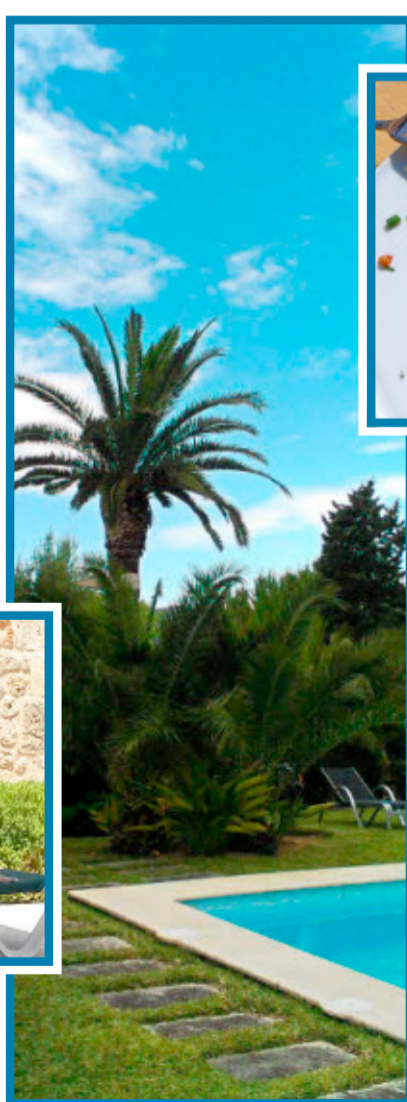
...und der Pool ist natürlich ein Muss – mehr braucht es nicht zum Glücklichein.

Die Acht-Stunden-Siesta auf der durchgelegenen Pool-Liege hat unseren Lebensrhythmus verändert. Wir essen spät