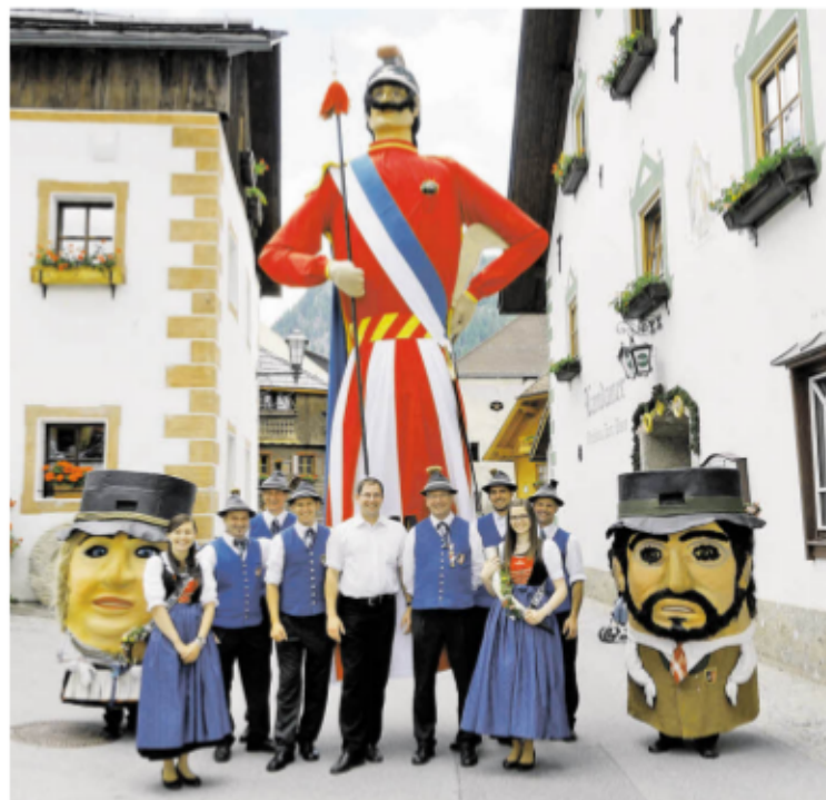
Das Lungauer Samson-Brauchtum ist im Fernseh-Zweiteiler ebenfalls zu sehen. Im Bild die Samsongruppe Mauterndorf.