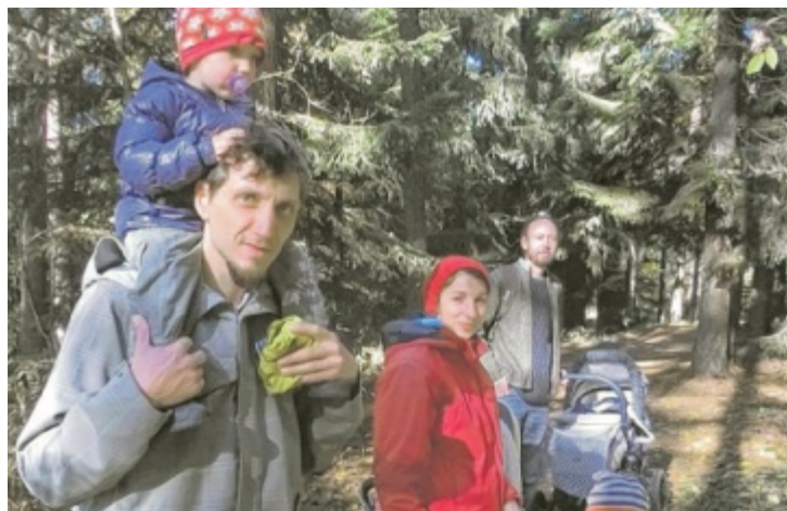
Wandererlebnis für die ganze Familie

dann praktisch jeden zweiten Tag, bei jedem Wetter, eine Tour. „Mit dem Kinderwagen bewanderten